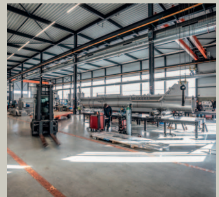
Machines voor de verwerking van aardappelen brengen Tummers naar positie 69.