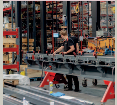
Voortman Steel Machinery is beland op plek 42.