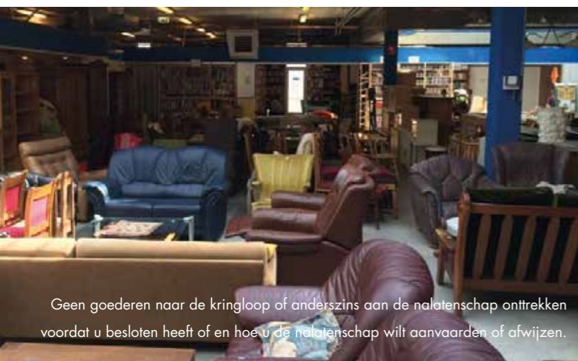
Geen goederen naar de kringloop of anderszins aan de nalatenschap onttrekken voordat u besloten heeft of en hoe u de nalatenschap wilt aanvaarden of afwijzen.

Niet iedereen is goed op de hoogte van de wet. Vaak aanvaarden erfgenamen een erfenis zonder het te weten. Dat kan al door dingen te doen die voor de hand lijken te liggen. Bijvoorbeeld het huis alvast leeghalen of kleine schulden alvast betalen. Door die acties aanvaardt de erfgenaam onbewust de nalatenschap. Als er dan later meer schulden dan bezittingen zijn, zit de erfgenaam vast aan betaling van het tekort. Een groot probleem van de 'oude' wetgeving was, dat een (onbewuste) aanvaarding van de erfenis niet teruggedraaid kon worden. Dat is per 1 september veranderd.